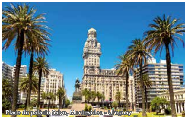
Place du palacio Salvo, Montevideo - Uruguay

La capitale de l'Uruguay, ancienne colonie espagnole bordée par les rives du fleuve Plata, offre à ses habitants une exceptionnelle qualité de vie. La vieille ville, « Ciudad Vieja », abrite des monuments d'architecture néoclassique et Art déco, mais aussi la cathédrale, le palais Salvo ou le théâtre Solís. Marchés artisanaux traditionnels, belles plages, ruelles animées, jardins et places font de cette ville empreinte d'un passé colonial vivace une escale agréable.