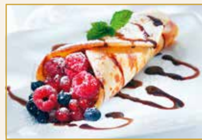
Suggestion de dessert