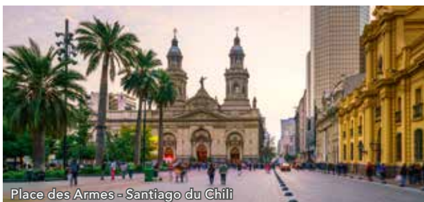
Place des Armes - Santiago du Chili

Arrivé à Santiago, vous serez accueilli et transféré vers votre hôtel Pullman Santiago Vitacura 4* normes locales (ou similaire). Après déjeuner, vous partirez pour un tour panoramique de la ville : la colline San Cristobal d'où vous apprécierez le point de vue exceptionnel sur