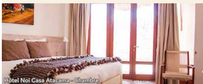
Hôtel Noi Casa Atacama - Chambre

Il se trouve au cœur de San Pedro de Atacama, tout proche du désert d'Atacama, le plus aride au monde. Niché au milieu de somptueux paysages, ses chambres spacieuses et lumineuses offrent un grand confort, une décoration soignée et tous les équipements nécessaires. Il abrite un restaurant, un spa et une piscine extérieure.