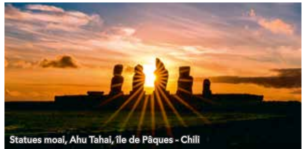
Statues moai, Ahu Tahai, île de Pâques - Chili