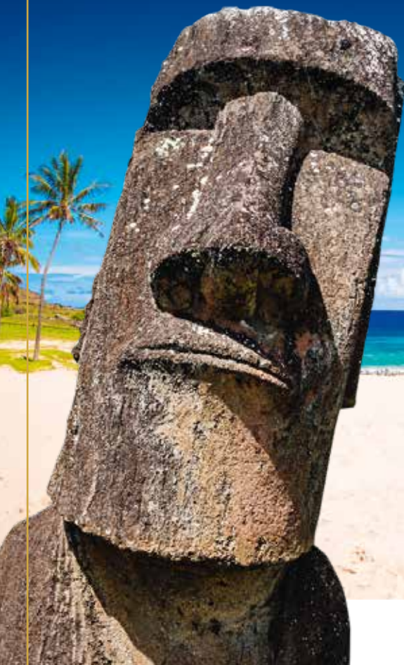
Île de Pâques - Chili