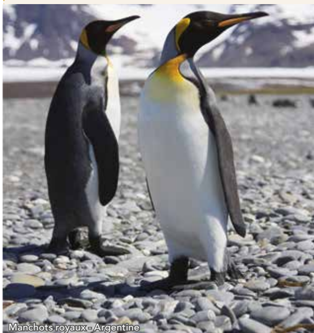
Manchots royaux - Argentine

Vous serez transféré en 4x4 jusqu'au lagon Bluff Cove. Cette réserve abrite plus de 1 000 couples reproducteurs de manchots papous, qui protègent la colonie croissante de manchots royaux et leurs poussins. Les manchots de Magellan pourront également se trouver sur la plage, tout comme les labbes, les ouettes de Magellan, les ouettes à tête rousse, les huîtres de Garnot, les goélands de Scoresby, les brasseurs des Malouines, les chionis blancs et les pétrels géants. Puis vous vous réchaufferez au légendaire Sea Cabbage Café et profiterez de friandises faites maison. Le Bluff Cove Museum & Shop, situé non loin, dépeint la vie des Malouines et raconte l'histoire de Bluff Cove.