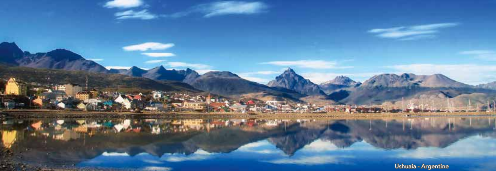
Ushuaia - Argentine