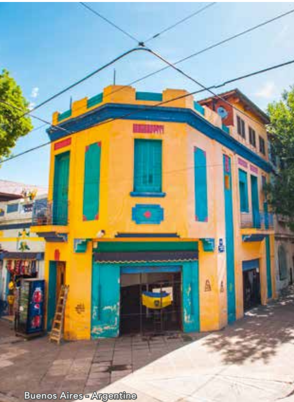
Buenos Aires - Argentine