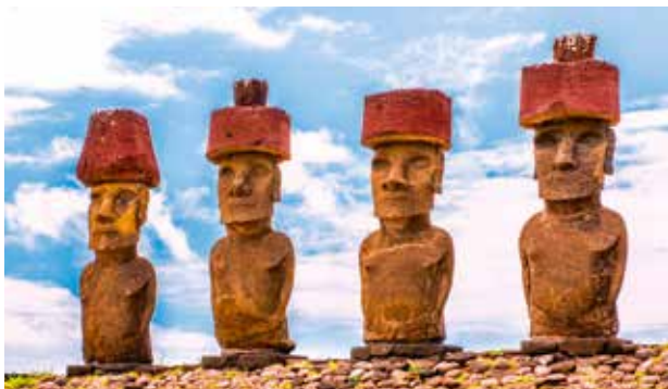
Quatre moais, site d'Ahu Akivi, île de Pâques - Chili

et restauré dans les années 50. Il offre une large vue sur la partie occidentale de l'île. Là, sept moais, tous semblables, d'environ 4 m de haut, sont tournés vers l'océan, orientation contraire aux autres statues de l'île. Vous continuerez ensuite vers Puna Pau, seul site volcanique de roche rouge, qui servit à la fabrication de pukao et des moais. Vous vous rendrez ensuite sur le site d'Ahu Tahai. Ce site archéologique abrite trois ahu : Kote Riku, Tahai et Vai Uri. Puis, vous vous promènerez dans un marché local avant de retourner à votre hôtel pour dîner.