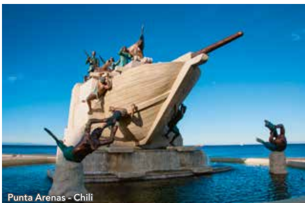
Punta Arenas - Chili

Punta Arenas, la capitale de la province de Magellan, se situe dans la péninsule de Brunswick. Occupée à son origine par une population amérindienne, la ville fut d'abord une colonie pénitentiaire peuplée de renégats et de criminels. Elle le restera jusqu'en 1867, date à laquelle le président José Joaquín Pérez met en place une politique pour attirer les immigrants et fait de Punta Arenas un port franc. S'y développera également une grande tradition d'élevage de moutons. La ville abrite de riches demeures qui entourent joliment la place Muñoz Gamero, de somptueux palais, comme le palais Sara Braun et la résidence Mendez qui témoignent du passé grandiose de la ville.