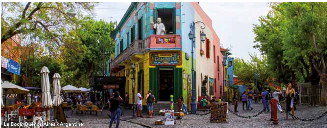
La Boca, Buenos Aires - Argentine

Après votre petit déjeuner à bord, vous rejoindrez l'aéroport. Vous décollerez sur un vol régulier (avec ou sans escale) à destination de Genève où vous arriverez dans la journée le samedi 19 décembre.