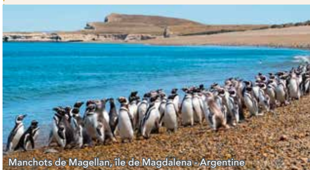
Manchots de Magellan, île de Magdalena - Argentine

Vous emprunterez un ferry qui traversera le détroit de Magellan avant d'atteindre l'île de Magdalena. Vous découvrirez une réserve naturelle créée pour protéger la faune locale. Elle abrite les manchots de Magellan qui viennent y nidifier, de nombreux cormorans et d'autres oiseaux indigènes. C'est une occasion unique d'observer une des plus grandes colonies de manchots dans le sud du Chili.