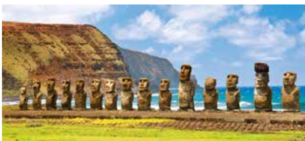
Ahu Tongariki, île de Pâques - Chili

Après le petit déjeuner, vous effectuerez un tour complet de l'île en passant par le sud et le site non restauré de Hange te'e et Akahanga, lieu où serait enterré le roi Hotu Matua. Vous continuerez vers Ahu Tongariki où se dressent 15 moais, sûrement le lieu le plus emblématique de l'île de Pâques, puis vous irez jusqu'au volcan Rano Raraku, dont les pierres ont servi à la fabrication des moais. Après le déjeuner, vous partirez vers Te Pito Kura et la plage d'Anakena, où vous profiterez d'un barbecue. Vous aurez un peu de temps libre pour profiter de la plage avant de retourner à votre hôtel.