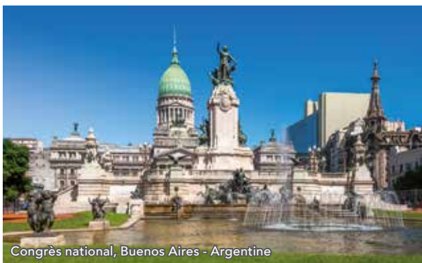
Congrès national, Buenos Aires - Argentine

Buenos Aires (Argentine) | Arrivée à 08 h