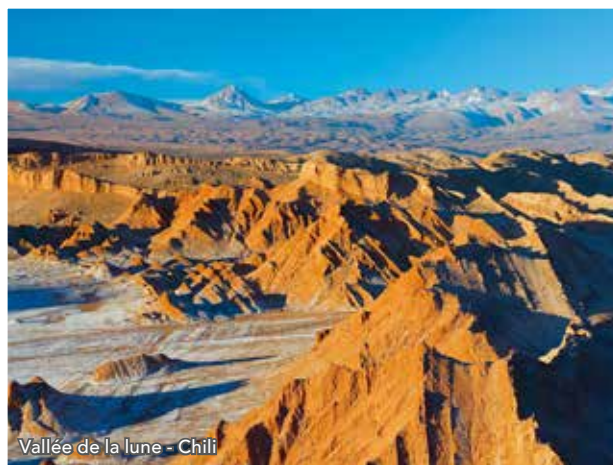
Vallée de la lune - Chili

À l'arrivée au Chili, vous serez accueilli et transféré vers l'Hôtel Pullman Santiago Vitacura 4* (normes locales ou similaire). Vous partirez déjeuner puis irez à la découverte de Santiago du Chili en commençant par le palais présidentiel, la place d'armes avec son impressionnante cathédrale, le Palacio de la Real