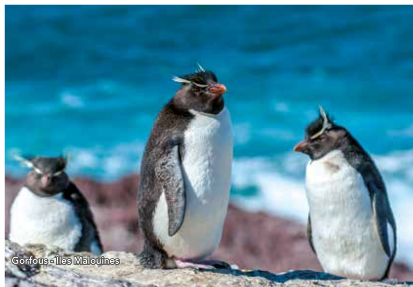
Gorfous - Îles Malouines