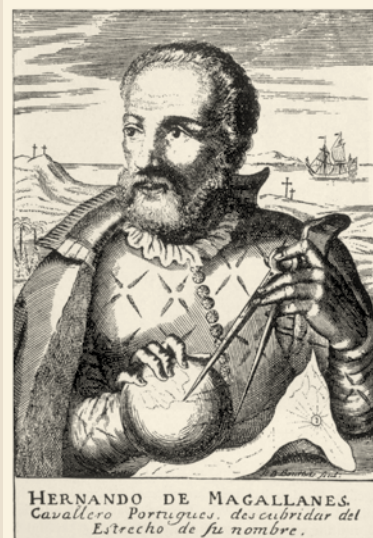
Fernand de Magellan (1481-1521)