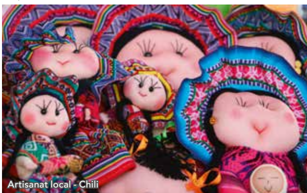
Artisanat local - Chili

Après le petit déjeuner, vous partirez explorer le Salar d'Atacama, situé au sein du désert. En dessous se trouve un lac salin, caché par la croûte solide de sel. Vous découvrirez ensuite le Salar de Aguas Caliente, plus connu sous le nom de Piedras Rojas pour ses pierres rouges liées à l'oxydation du fer. Vous reprendrez la route pour vous rendre dans le petit village traditionnel de Socaire, où se trouve le plus vieux clocher du Chili. Après le déjeuner, vous partirez à la découverte de la superbe laguna Tuyacto, d'un bleu laiteux très clair et entourée de montagnes. Avant de retourner à San Pedro de Atacama pour dîner, vous passerez par le village de Toconao, son église, sa place centrale et son marché artisanal.