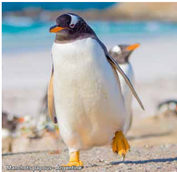
Manchots papous - Argentine

* Si les conditions météorologiques le permettent.