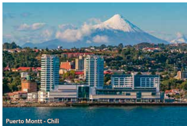
Puerto Montt - Chili

Fondée par des colons allemands au milieu du XIX e siècle, Puerto Montt dispose d'une architecture européenne avec de vieilles maisons en bois aux toits pentus et aux balcons richement décorés, qui rendent cette ville chaleureuse. Sur la place principale trône une étonnante église construite à partir de bois de séquoia surmontée d'un clocher de cuivre. La région de Puerto Montt offre des paysages naturels d'une grande beauté parsemés de lacs.