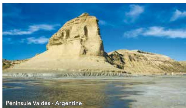
Péninsule Valdés - Argentine

Vous découvrirez la péninsule Valdés, une des plus sauvages réserves naturelles du monde et site classé au Patrimoine mondial de l'UNESCO. C'est le paradis des mammifères et oiseaux marins avec la plus importante concentration de faune de toute l'Argentine. Vous vous dirigerez ensuite vers l'Estancia San Lorenzo, abritant un centre de recherches dans lequel vous pourrez en apprendre davantage sur les manchots. Des milliers de manchots de Magellan ainsi que de nombreux autres oiseaux marins peuvent être observés sur la plage. Vous profiterez ensuite d'un délicieux barbecue, puis pourrez peut-être apercevoir des nandous, des lièvres de Patagonie ou encore des guanacos dans leur cadre naturel de vie, sur le chemin de retour au bateau.