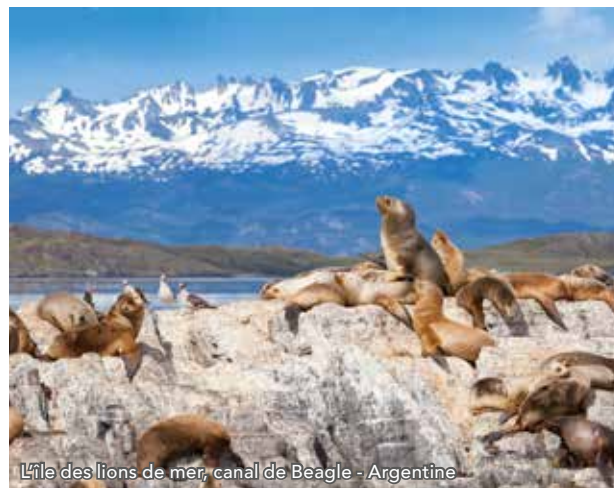
L'île des lions de mer, canal de Beagle - Argentine

Ushuaia est la ville la plus australe du monde, située entre le détroit de Magellan et le cap Horn. S'étirant le long d'une baie majestueuse, baignée par les eaux glaciales du canal de Beagle, la ville est entourée par la cordillère des Andes, et plus précisément par le mont Martial à l'ouest et les monts Olivia et Cinto Hermanos à l'est. Ses maisons de bois coloré, bleu, jaune, vert ou rouge, confèrent à la ville un charme incontestable.