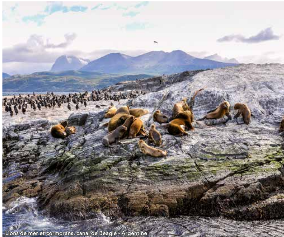
Lions de mer et cormorans, canal de Beagle - Argentine