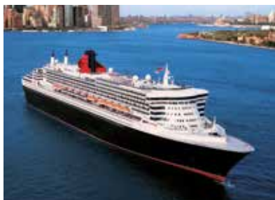
Queen Mary II