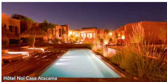
Hôtel Noi Casa Atacama

* En fonction des horaires d'avion, le programme de cette journée peut subir des modifications.