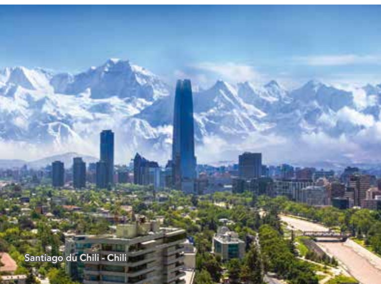
Santiago du Chili - Chili