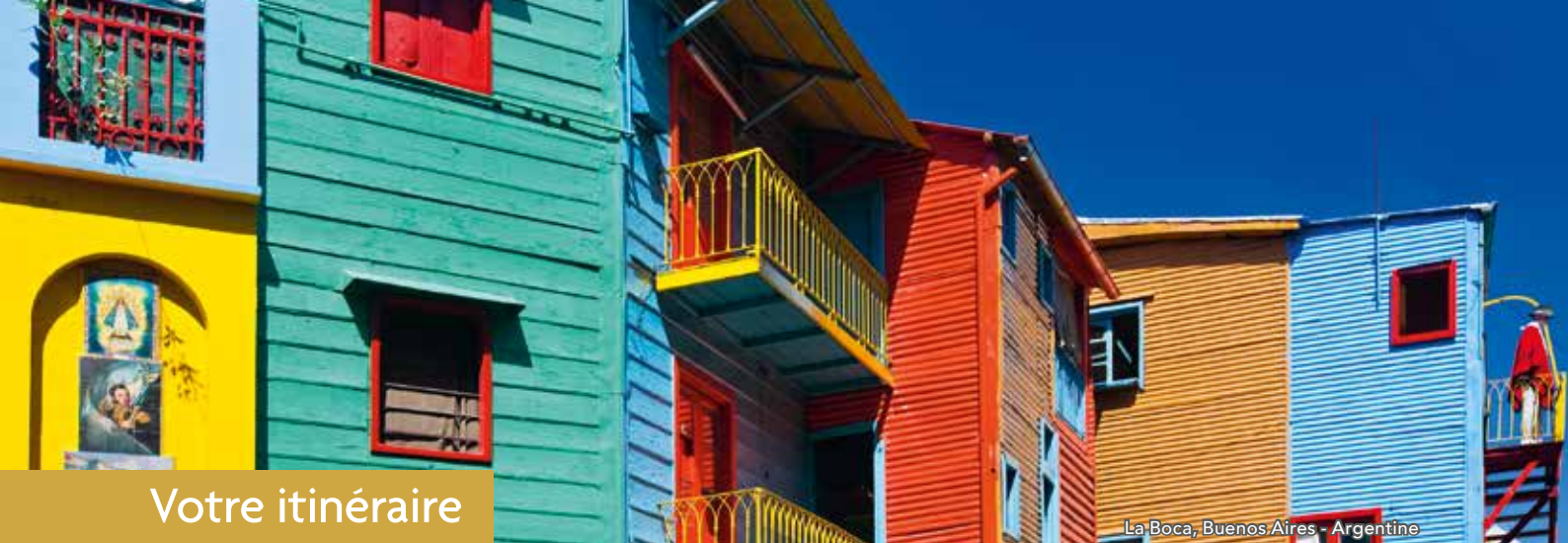
La Boca, Buenos Aires - Argentine