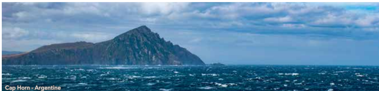
Cap Horn - Argentine

Lors de cette journée, vous profiterez des installations du bateau et assisterez aux conférences animées par nos spécialistes.