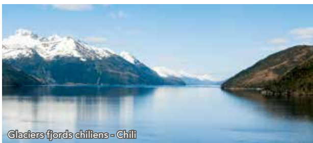
Glaciers fjords chiliens - Chili

Long de 611 km, le détroit de Magellan est le plus important passage naturel entre le Pacifique et l'Atlantique. Il tient son nom de Fernand Magellan qui fut le premier navigateur européen à le franchir en 1520. Cette ouverture entre les deux océans va permettre alors le développement commercial du trafic et attirera de nombreux pirates et corsaires dont Francis Drake qui le franchira à son tour, par une autre voie en seize jours et laissera son nom à l'un des passages. Entouré de cimes enneigées qui se reflètent dans les eaux pures, ce détroit glisse dans un labyrinthe de fjords où s'étirent majestueusement de gigantesques glaciers millénaires. Une nature toute-puissante et dominante dont vous profiterez pleinement installé sur les ponts extérieurs du bateau.