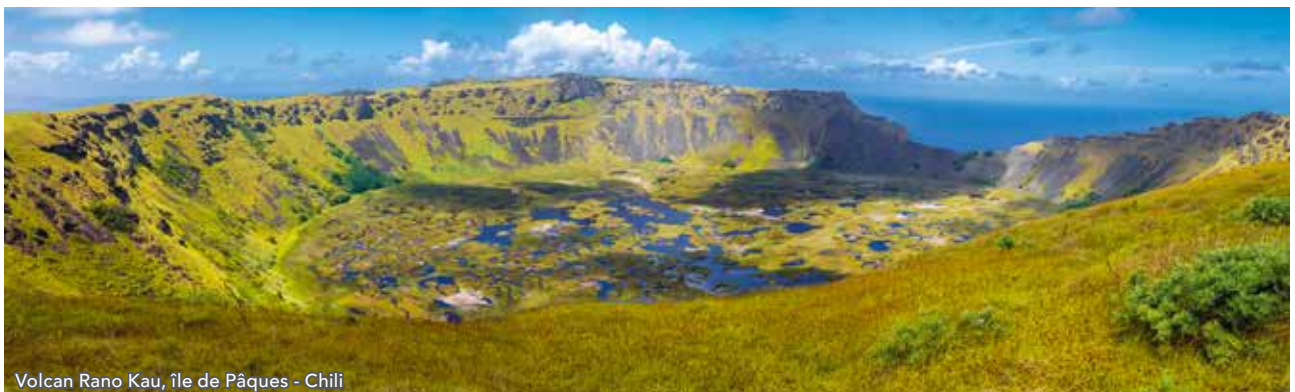
Volcan Rano Kau, île de Pâques - Chili

Après le petit déjeuner à l'hôtel, vous partirez vers l'aéroport d'où vous vous envolerez à destination de l'île de Pâques. Une fois sur place, vous partirez à la découverte du site Ahu Akivi, construit en 1460