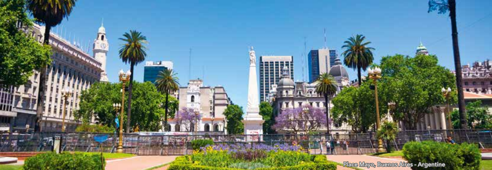
Place Mayo, Buenos Aires - Argentine