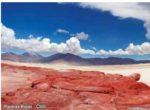
Piedras Rojas - Chili

Après le petit déjeuner, vous partirez explorer le Salar d'Atacama, situé au sein du désert. En dessous se trouve un lac salin, caché par la croûte solide de sel. Vous découvrirez ensuite le Salar de Aguas Caliente, plus connu sous le nom de Piedras Rojas pour ses pierres rouges liées à l'oxydation du fer. Vous reprendrez la route pour vous rendre dans le petit village traditionnel de Socaire, où se trouve le plus vieux clocher du Chili. Après le déjeuner, vous partirez à la découverte de la superbe laguna Tuyacto, d'un bleu laiteux très clair et entourée de montagnes. Avant de retourner à San Pedro de Atacama pour dîner, vous passerez par le village de Toconao, son église, sa place centrale et son marché artisanal.