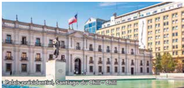
Palais présidentiel, Santiago du Chili - Chili

À l'arrivée au Chili, vous serez accueilli et transféré vers l'Hôtel Pullman Santiago Vitacura 4* (normes locales ou similaire). Vous partirez déjeuner puis irez à la découverte de Santiago du Chili en commençant par le palais présidentiel, la place d'armes avec son impressionnante cathédrale, le Palacio de la Real